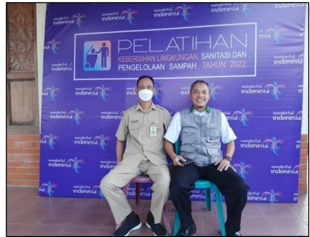
Gambar 4. Promosi Wisata melalui Pelatihan Kebersihan yang diadakan di lokasi wisata oleh dinas Kesehatan Kab Pacitan

wilayah. Maka kebersihan lokasi wisata harus tetap dijaga.