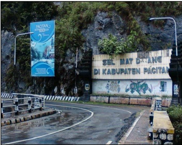
Gambar 2. Pemasangan Banner 1001 Goa di perbatasan Pacitan-Ponorogo