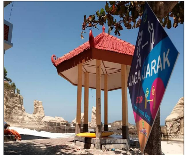
Gambar 9.1 Pembatasan jaga jarak

Peraturan pemerintah yang masih membatasi jumlah pengunjung wisata beberapa aktifitas di masa pasca Covid-19 ini tentunya menyebabkan beberapa penghambat bagi Dinas Pariwisata untuk melakukan promosi wisata seperti pemberlakuan batas maksimal pengunjung yaitu 25 persen pengunjung dari tahun lalu. Wisata ini mempengaruhi Dinas Pariwisata dalam melakukan promosi wisata takutnya nanti kalau wisata Dinas Pariwisata promosikan bahwa sudah dibuka maka akan menyebabkan membeludaknya wisatawan. Sementara kalau Dinas Pariwisata menolak dan menerapkan antrian tidak mungkin karena kasihan yang sudah jauh-jauh dari Solo, Jogja maka akan menunggu ke tempat wisata. Selain itu juga orang yang berwisata tidak mungkin Dinas Pariwisata batasi waktunya sekian-sekian (Wawancara, Samsul Muhammadi, Sos., M.M Kepala seksi sumber daya pariwisata 25 Juli 2022)