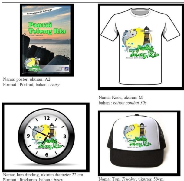
Gambar 6. Penggunaan ikon Teleng Ria disetiap produk yang dijual