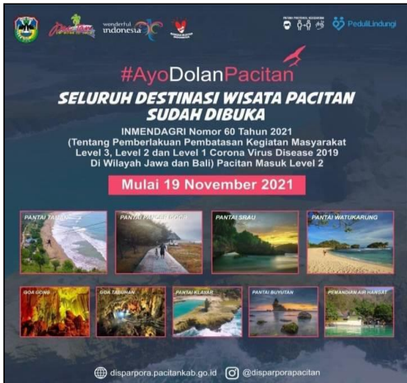
Gambar 8. Pengumuman pembukaan wisata pasca covid-19