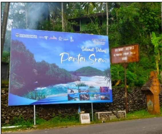
Gambar 3. Pemasangan Banner Pantai Srau