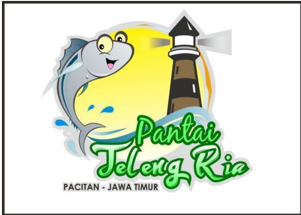
Gambar 5. Ikon Yang terpilih