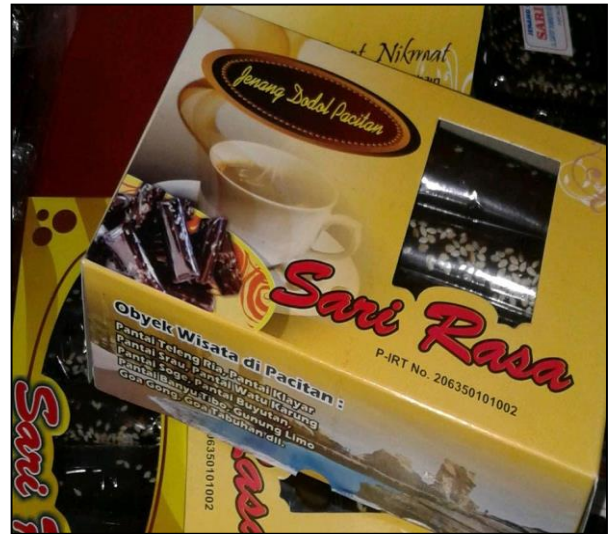
Gambar 7. Promosi wisata melalui produk yang dijual

Dinas Pariwisata pun juga mendapatkan keuntungan yang banyak. (wawancara sumarni, pedagang pantai Teleng Ria, 24 Juli 2022).