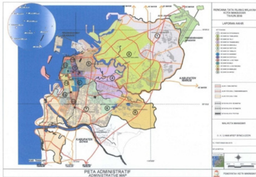
Gambar 4.1 Peta Wilayah Administrasi Kota Makassar