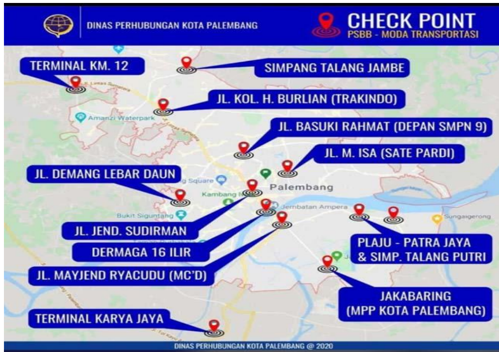
Gambar 2. Peta Pos Covid Kota Palembang