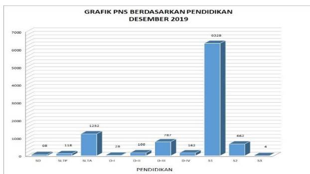
Gambar. 3. PNS Berdasarkan Pendidikan 2019